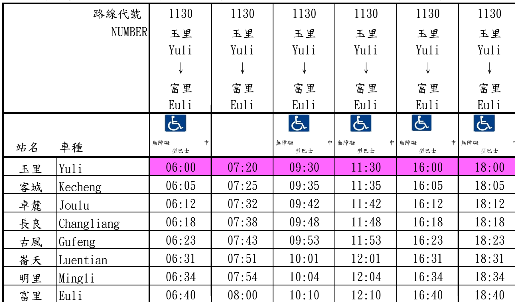
花蓮客運 玉里-富里 線 時刻表 For Yuli-Euli Line (下行)